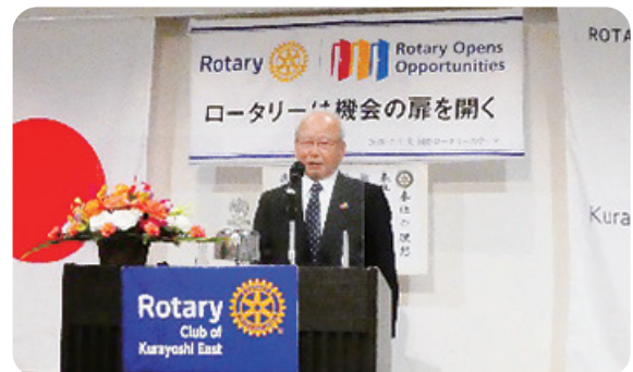
道上正規ガバナー補佐様