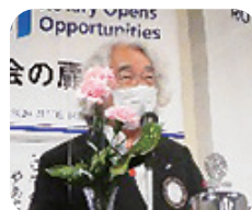
福山育録職業分類 会員選考委員長