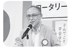
藤原 記念講演・事業式典担当委員