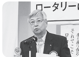
清水会長 登録・会場設営について