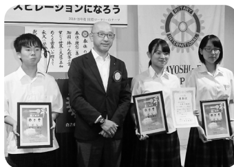
3年生受賞者の皆さん