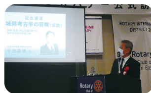
額田雅之随行者様による地区大会のPR