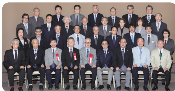
例会終了後記念撮影