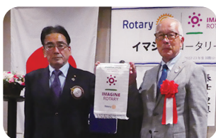
国際ロータリーのテーマバナーの披露